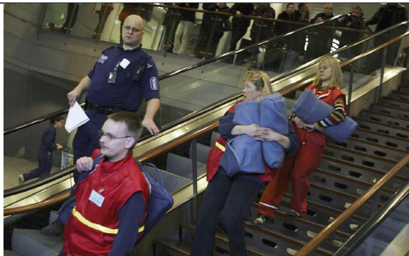
Vapaaehtoisia Kaakkois-Aasian tsunamialueelta palaavien järkyttyneiden tukena.